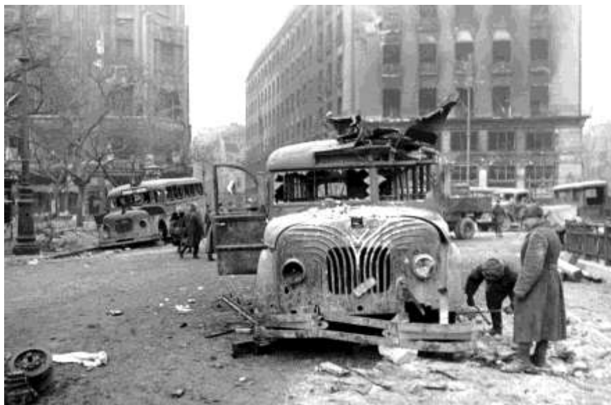
Одна из улиц Будапешта после освобождения города, 1945 год

После разграбления страны немецкими оккупантами и вывозе большого количества продовольствия в Германию венгерский народ, а особенно население Будапешта, находилось в очень трудном положении. Жители столицы были обречены на голод, поэтому уже в марте 1945 года правительство Советского Союза приняло решение об отправке в Венгрию продовольствия, а с июля 1945 года были введены новые увеличенные нормы снабжения продуктами.