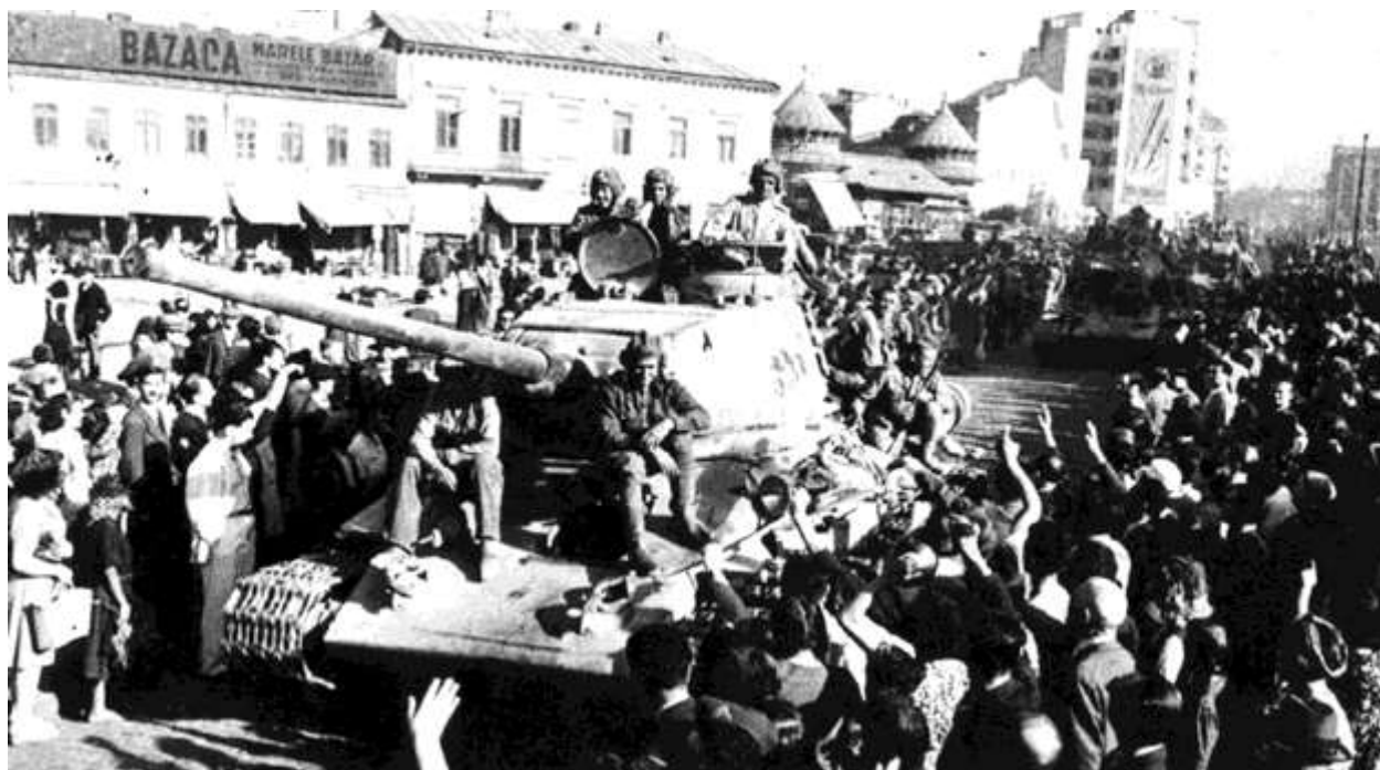
Войска Красной армии на улицах Бухареста

Простые румынские крестьяне и жители городов с радостью приветствовали свою освободительницу – Красную Армию, угощали советских бойцов, помогали им, чем могли.