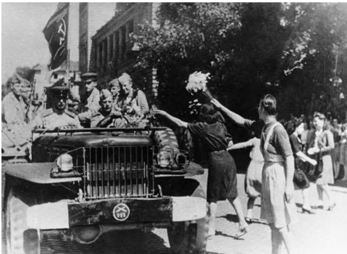
Жители Софии приветствуют части Красной Армии, вступающие в город

Переход Румынии в стан антигитлеровской коалиции стал причиной перестановок в софийском руководстве, которое заявило о своем нейтралитете. Однако немецкие части продолжали свободно передвигаться по Болгарии. 5 сентября 1944 года СССР вынужден был объявить войну Болгарии, так как на ее территории находились значительные силы Германии.